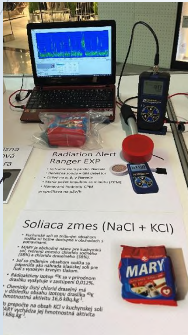
Radiation Alert Ranger EXP