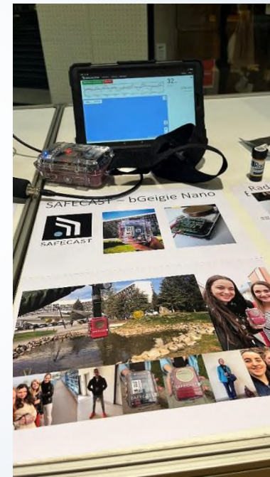
bGeigie Nano - Safecast